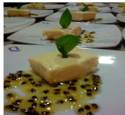
Postre de mango